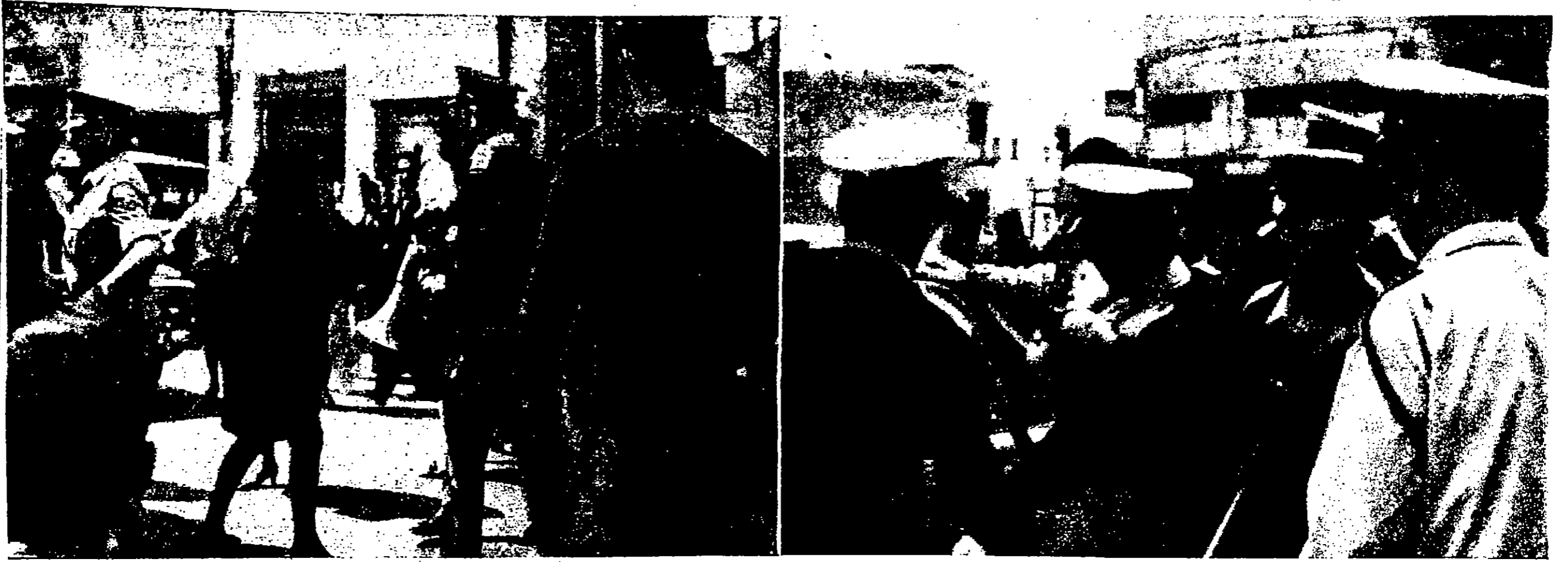
مشاهد أخرى من مظاهرة النساء العربيات في القدس يوم أمس الأول الذي جال اليونسكو الإسرائيلي يهيبون باقراعات لاعتقالهن